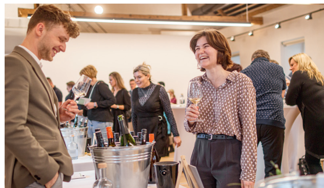
Chutnáme Znojmo 2024